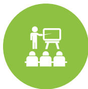
Imagen de marca, Know-how del franquiciador, mayor oferta, precio más competitivo, trabajar dentro de un equipo multidisciplinado, mayor velocidad de crecimiento, formación continuada, Dpto. Marketing, Dpto. Informático, Dpto. Colocación de riesgos, contar con multitarificador Avant2, adaptación a la LOPD, PREBLAC...